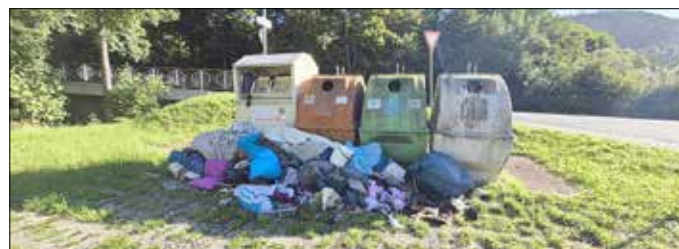
Nebenablagerungen bei Altkleidercontainern in Probstzella

Der ZASO wird die Städte und Gemeinden des Versorgungsgebiets für Oktober zu einem Gespräch einladen. Ziel ist es, gemeinsam praktikable Lösungen zu finden, die die Sammlung, Sortierung und Verwertung von Alttextilien verbessern. Wir möchten mit den kommunalen Partnern Maßnahmen erarbeiten, die illegale Ablagerungen verhindern, die Sammlung effektiver machen und die Kosten für alle minimieren.