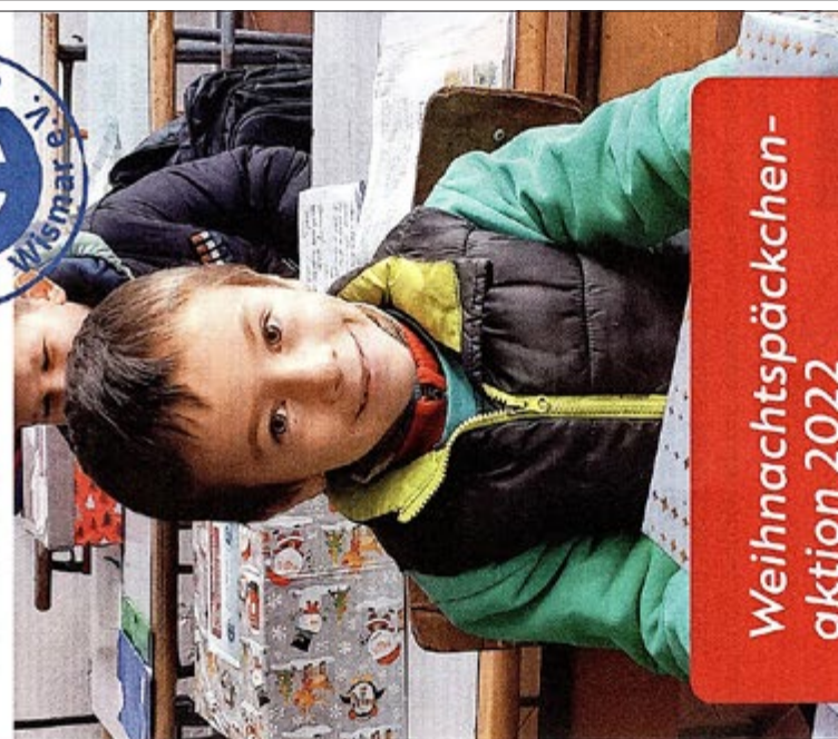
Design: Studio2.de