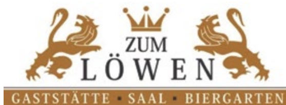
Was ist los im November?