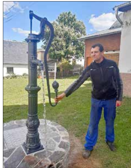
Lange Zeit war unser Brunnen nicht mehr betriebsfähig.