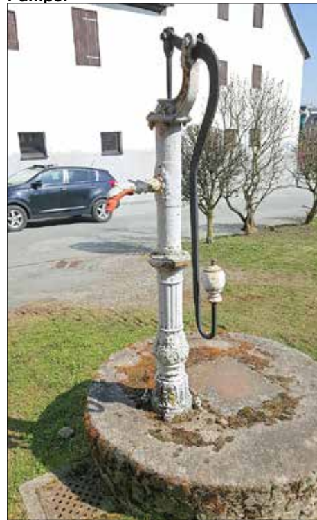
Die Handschwengel Pumpe im alten Gewand mit vermoosten Brunnenrand.