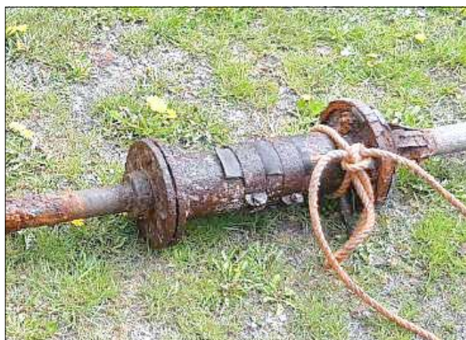
Dann ging es dem alten Arbeitszylinder zu Werke.