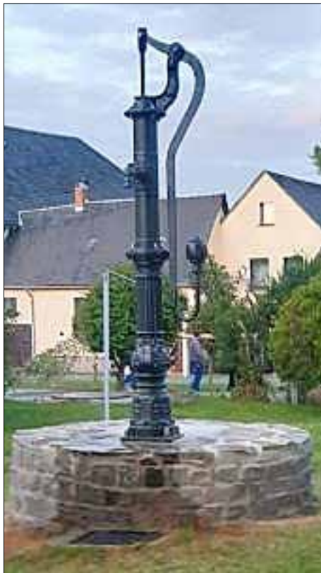
Das Ergebnis kann sich sehen lassen.