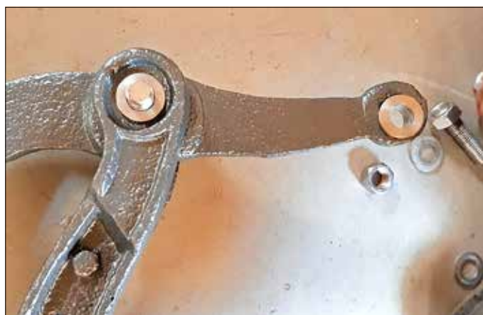
Der Hubarm bekam neue Drehbuchsen.