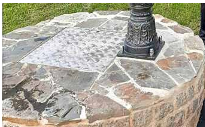
Der Brunnendeckel wurde mit Natursteinen aus unserem Dorf belegt.