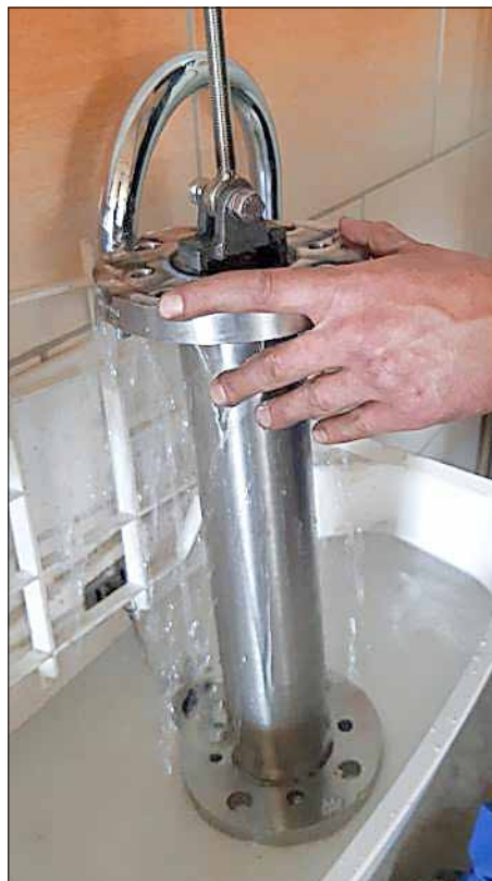
Der neu angefertigte Arbeitszylinder beim Probepumpen.