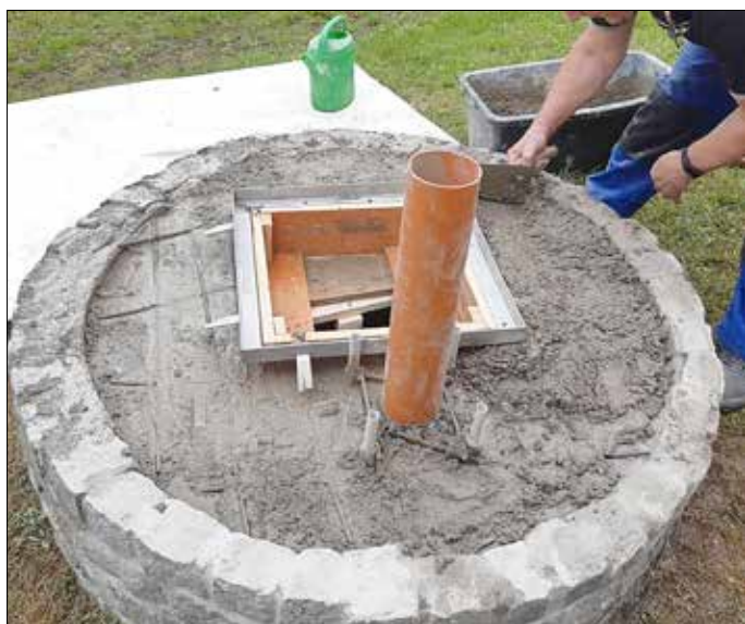
Ein Betondeckel mit Armierungseisen wurde hergestellt. Revisionsdeckel musste auch sein. Löcher für Hubstange und Pumpenbefestigung wurden gleich mit angelegt.