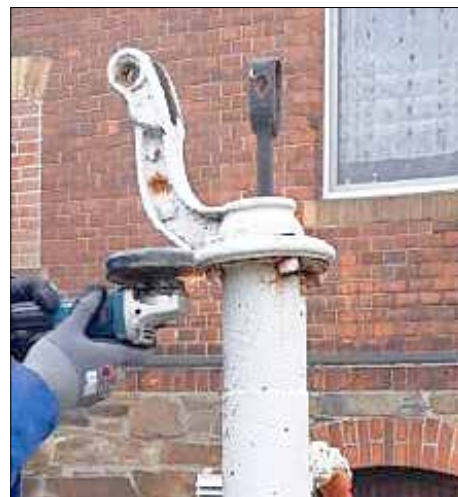
Um die alten Teile zu erhalten, wurde mit „leichtem“ Gerät die Pumpe zerlegt.