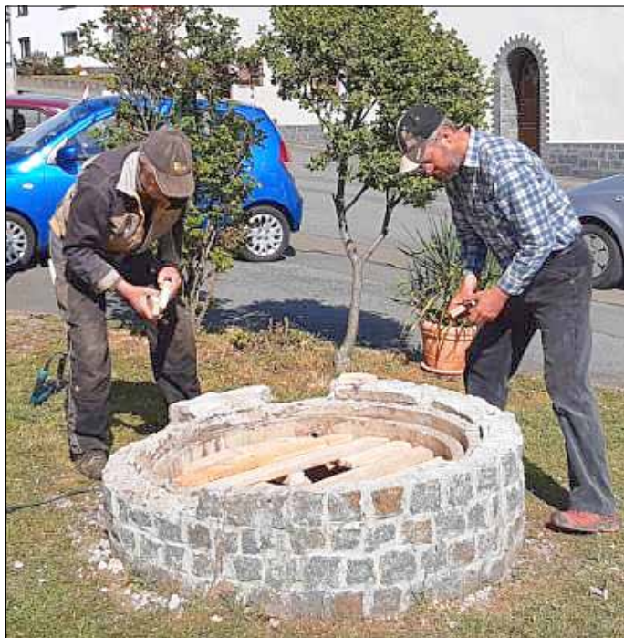
Da kamen Zimmerleute und schalten den Brunnen ein.