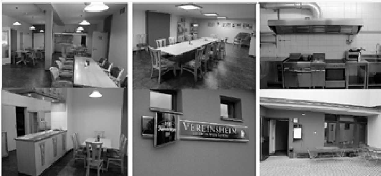
Angaben zur Gaststätte