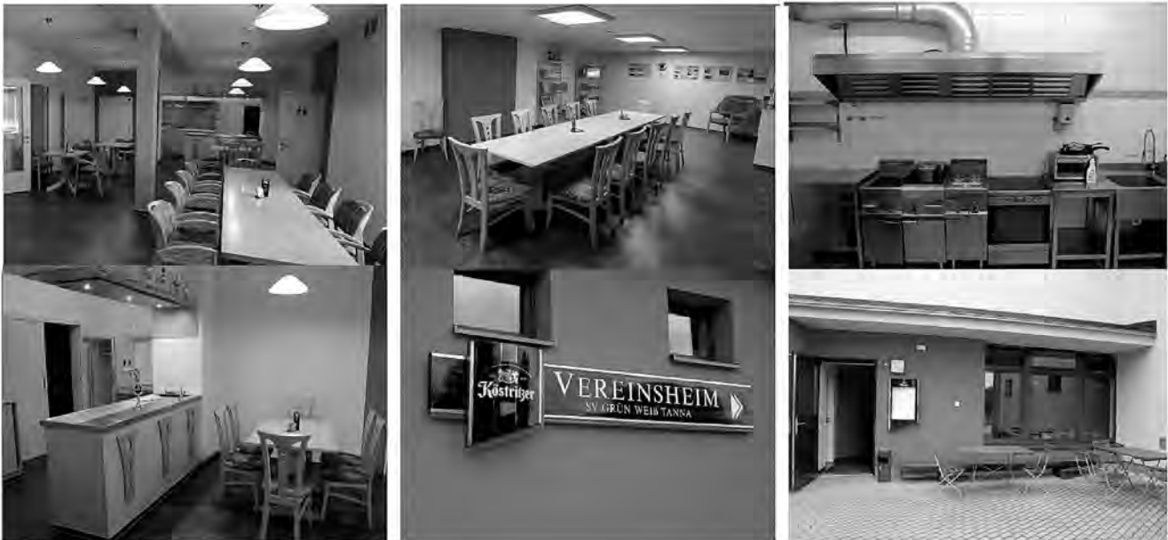
Angaben zur Gaststätte